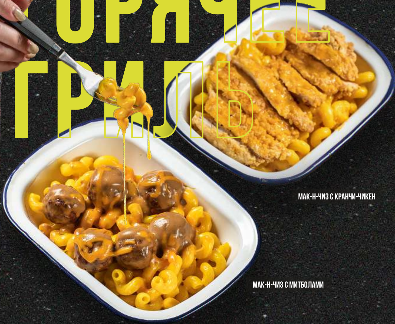
МАК-Н-ЧИЗ С КРАНЧИ-ЧИКЕН