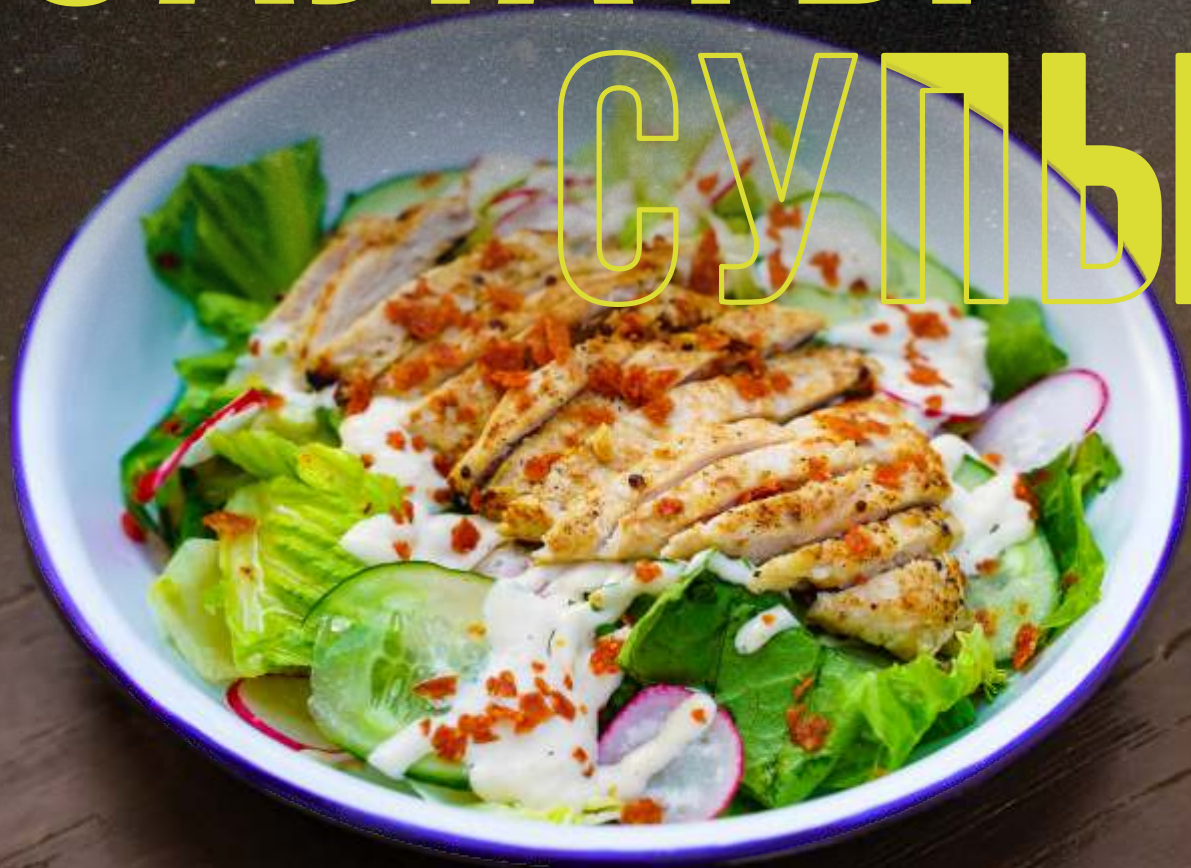
СТЕЙК-САЛАТ С ИНДЕЙКОЙ ГРИЛЬ